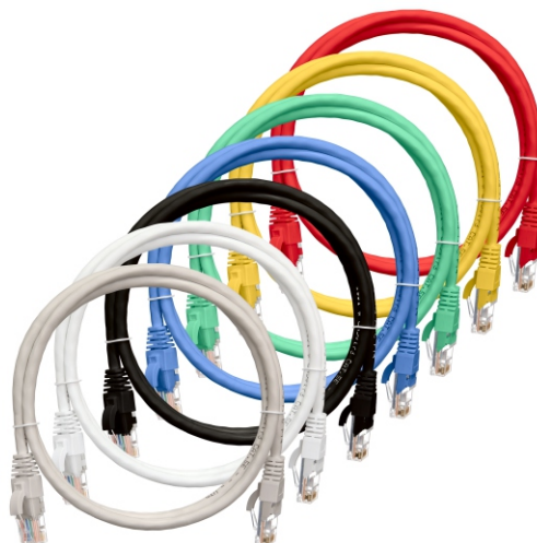
7 вариантов цветовых исполнений